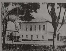
Praça Padre Espindola

O telhado, em capa e bica, apresenta cachorrada e beiral. Toda a fachada está pintada em branco, e o primeiro pavimento possui meia parede chapiscada em cimento. As paredes da parte frontal do primeiro pavimento, em adobe, impressionam pela espessura de mais de 90 centímetros. O segundo pavimento tem as paredes em tijolo maciço. Toda a pintura, tanto interna quanto externa, apresenta desgastes, perdas e deslocamentos. O piso da calça-